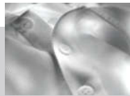
3 button placket

Decorators access: Open Decoration process: Transfer print, entorodery